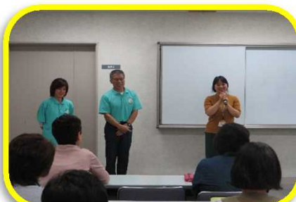
活躍中のサポーター1期生から活動のポイントを学ぶ(第3回目)