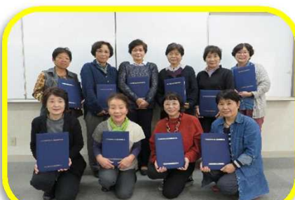
修了者で集合写真(第5回目)

次回の生活支援サポーター養成講座の開催日程が決まりましたら加西市広報、市ホームページなどでお知らせします！ ぜひご参加ください！！