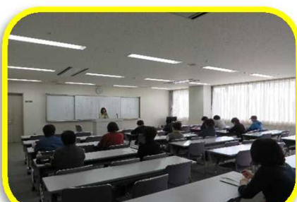
サポーターと修了者で集合写真(第5回目)しての注意点や心構えを学ぶ(第5回目)