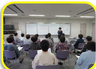
高齢化の現状を学ぶ(第1回目)