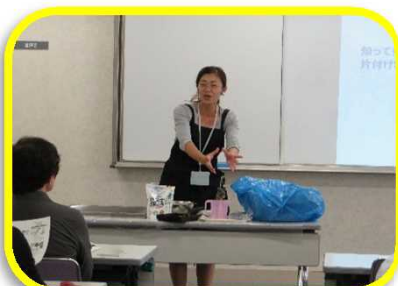
整理収納アドバイザーがお掃除のコツを伝授(第4回目)