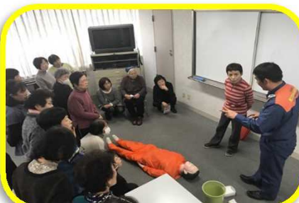
「高齢者のための救急講習」の様子(第2回目)