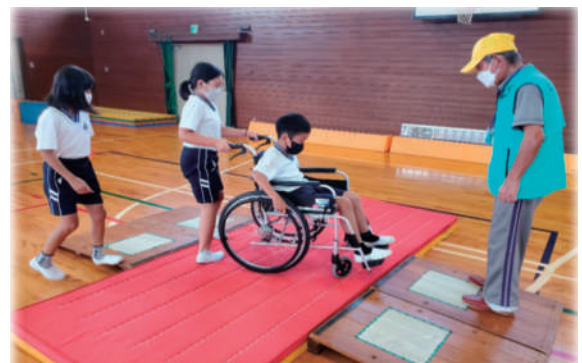
泉小学校 車いす体験