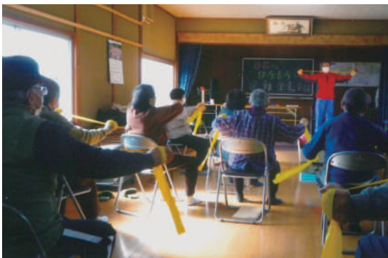
倉谷町 ふれあいいきいきサロン