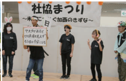
加西手話サークルどんぐり