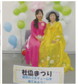
世界のコスチューム体験