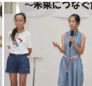
体験発表～宇仁小学校～