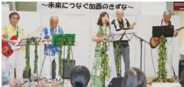
オープニング サイサイアイランダース