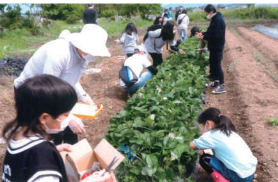
網引町 三世代交流 いちご狩り