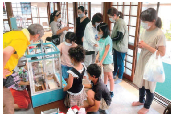
北条町黒駒 いきいきサロン