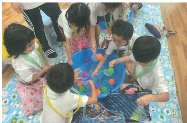
北条こども園 よいこのつどい