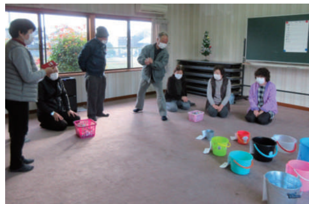
下宮木村町 いきいきサロン