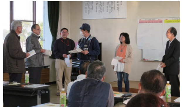
駐在さんを交えての寸劇

地域のサロンや学校、企業等へも出向きますので、気軽にご相談ください。受講者にはオレンジリングをお渡しします。