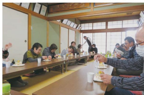
別府中町 ふれあいサロン