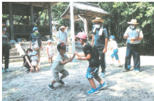
千ノ沢町 三世代交流祭り