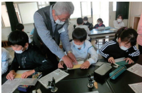
北条東小学校 点字体験