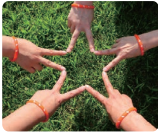
オレンジリング (認知症サポーターの証)

2012年からは、9月を「世界アルツハイマー月間」と定め、日本でも、認知症の普及啓発のためのさまざまな取り組みが行われています。