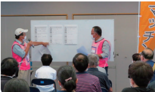
▲ 「マッチング班」 被災者からのニーズとボランティアを組み合わせました。