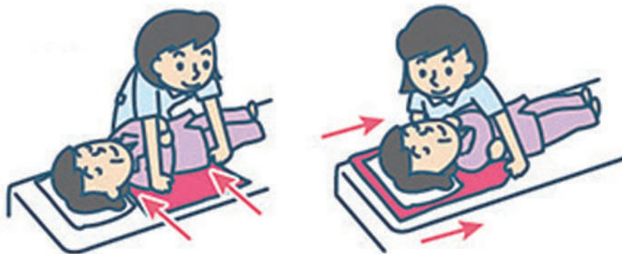
①身体の下にシート（ボード）を敷き込む ②滑り込ませるように身体を移動させる

スライディングシート（ボード）は、利用者の体を移動・移乗するための福祉用具です。摩擦の少ないすべりやすい素材でできており、身体とベッドの間に敷き込むことで、少しの力で移動・移乗の介助をすることができます。介助する側・される側の身体の負担を減らすことができます。