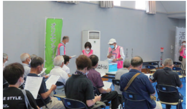
▲ 「オリエンテーション班」 被災者に寄り添うことの大切さや注意事項を確認。