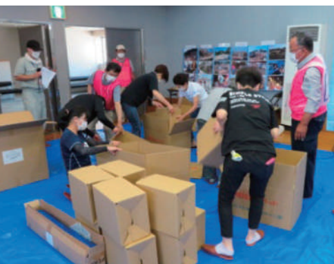
▲段ボールベッドを組み立て