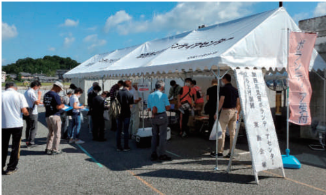
▲ 「ボランティア受付班」 感染症予防対策を行いながら受入れました。