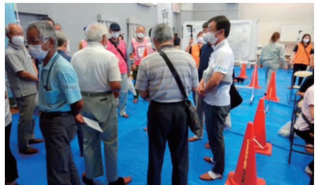
▲ 「グルーピング」 グループに分かれてリーダーを決め、派遣先までのルートを確認。