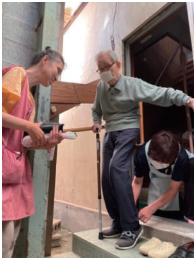
外出時に危険がないように見守りします。

訪問介護は、介護の専門資格を持ったホームヘルパーが、利用者宅を訪問し、入浴、排せつ、食事等の介助をする「身体介護」と調理、洗濯、掃除等の家事支援をする「生活援助」を行うサービスです。利用者の可能性を引き出す自立支援・重度化防止をモットーにお手伝いをさせていただいています。