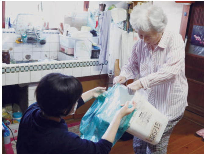
ゴミの仕分け作業のお手伝いをします。