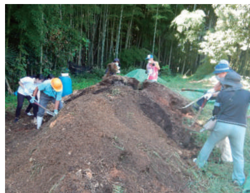
▲土砂撤去作業体験