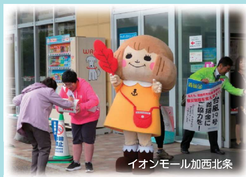
イオンモール加西北条