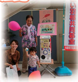
健康福祉会館のガチャ募金