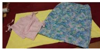
手芸・スカート、小物入れ