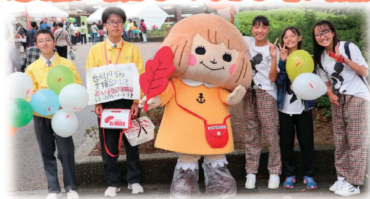
高校生ボランティアの募金活動 じば産物産展