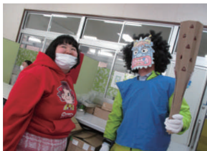
▲鬼と仲良くなりました～節分～