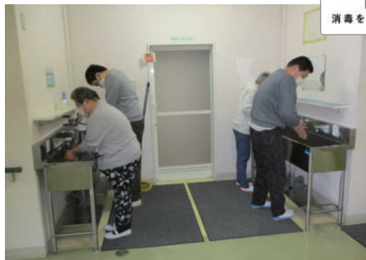
▲指の間、手首もしっかり洗います