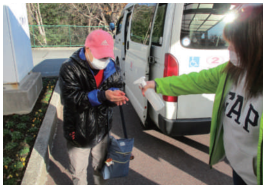
▲登園したら一番に、手指を消毒します