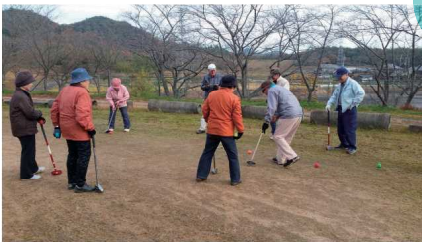
グラウンドゴルフで健康づくり♪