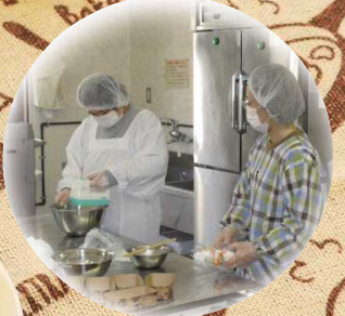
長石をモチーフにした 「ホロホロクッキー」