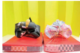
折り紙で作ったひな人形

いろんなことに興味があり、手先を使うことが好きで、作品づくりを始めました。今回は、折り紙でひな人形を作りました。他にも石けんづくりや、切り絵など、空いた時間を利用して、自宅で楽しんでいます。作品を友人にプレゼントすると喜んでくれるので、それも私の楽しみです。