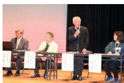
講演 & シンポジウム 「いざという時に!自然災害に備える」