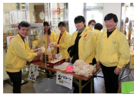
炊き出しや販売ボランティアさん