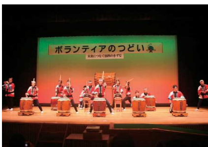
播州加西あばれ太鼓愛好会の皆さん

ホールの外では、スタンプラリー、炊き出し訓練を兼ねた昼食販売、バザー、加西の特産品の販売、消防署・自衛隊によるコスチュームブースなど盛況でした。また、記念すべき第20回を盛会裏に終えられたのも、力強いボランティアさんのご協力の賜物と感謝いたします。