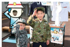
なりきり子ども自衛隊!