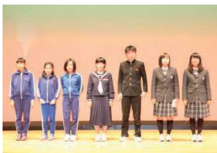
ボランティア活動の体験発表者