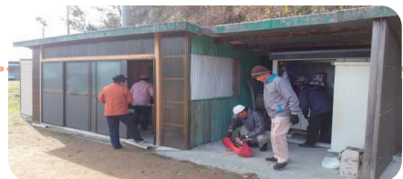
自分たちで手作りした「いこいの広場」

この日の参加者に「青野町のよいところ」をお尋ねすると「空気がよい」「町に子どもが多い」「三世代で暮らす世帯が多い」「人がよい」「宇仁の朝市や、週2回あるグラウンドゴルフなど毎週住民が集える場がある」など、たくさんのいい話を聞かせていただきました。地域にどう場があることは、生きがいや楽しみにつながり、地域が元気でいられる秘訣だと感じました♪