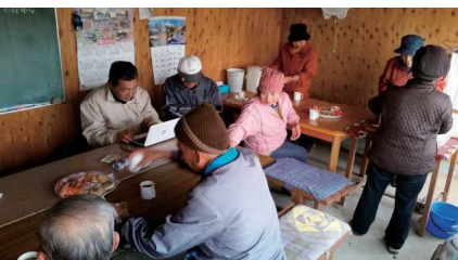
ゲーム終了後にお茶とお菓子で和気あいあい♪