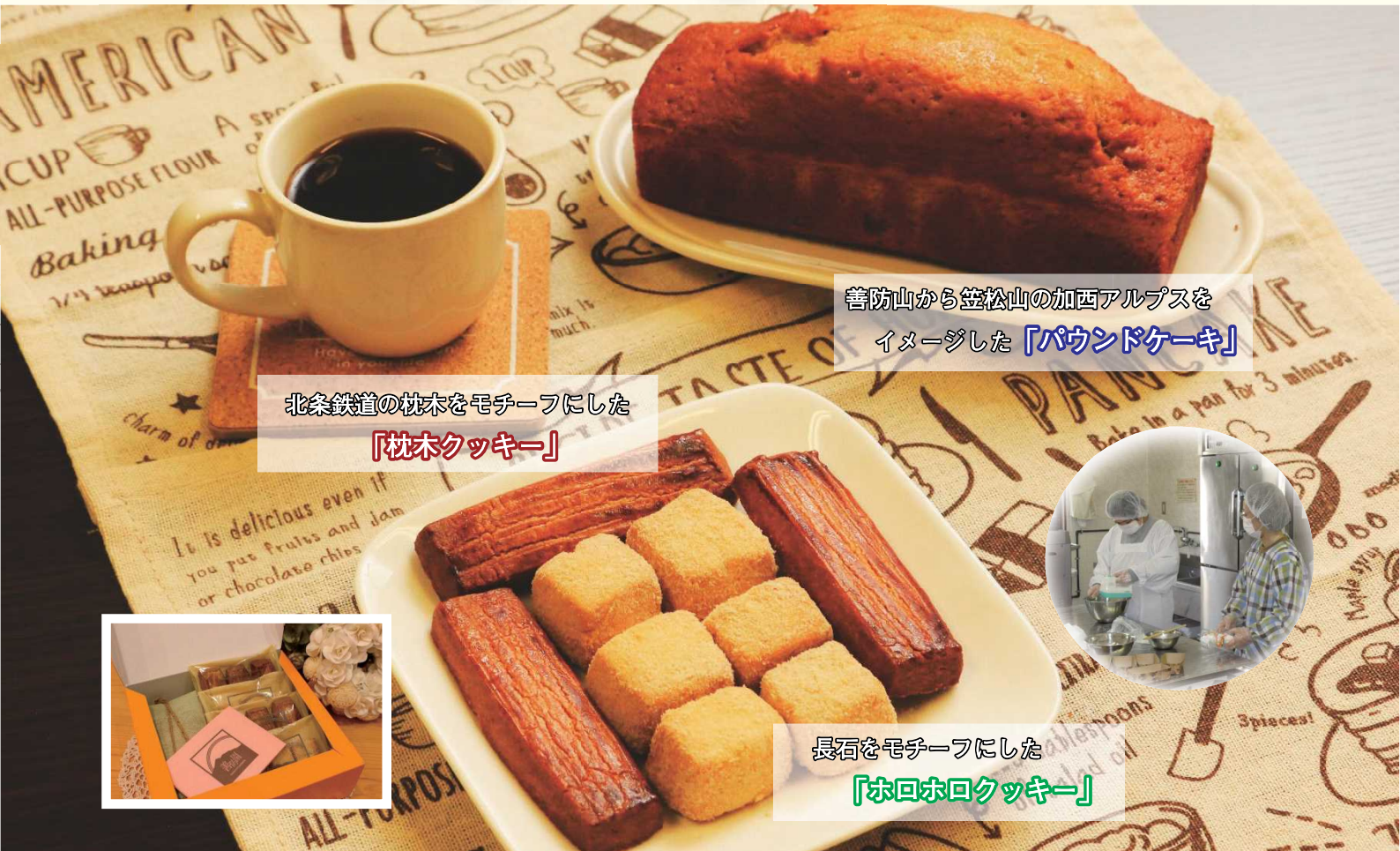
北条鉄道の枕木をモチーフにした 「枕木クッキー」