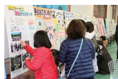
ボランティア活動パネル展示