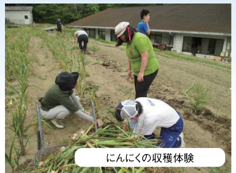
にんにくの収穫体験