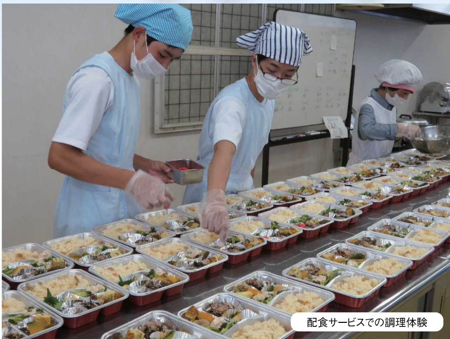
配食サービスでの調理体験