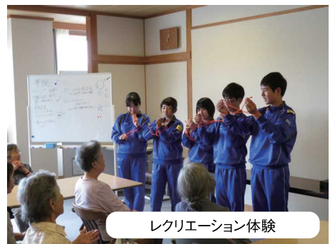
レクリエーション体験