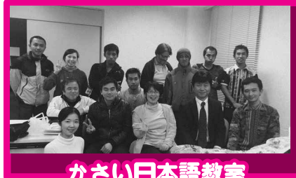
かさい日本語教室

かさい日本語教室は、市内在住の外国人の方々から日本語を学ぶ教室です。教室は毎週金曜日の夜7時半から健康福祉会館で開催され、様々な国からの受講生に日本人のボランティアが指導にあたります。外国人と友達になりたい方、一度教室を覗いてください。