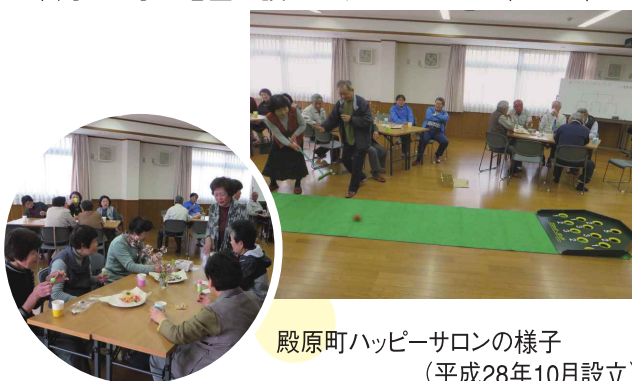
殿原町ハッピーサロンの様子 (平成28年10月設立)