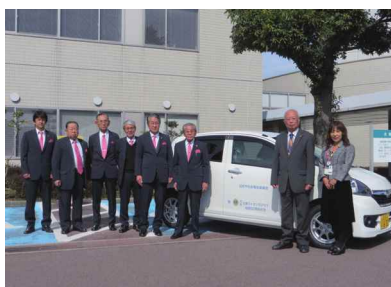
加西北条ライオンズクラブの皆さま

お気持ちに感謝し、地域福祉活動に活用させていただきます。ありがとうございました。