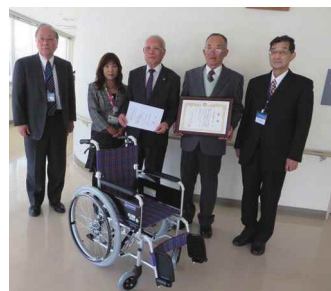
三洋電機洋友会の皆さま