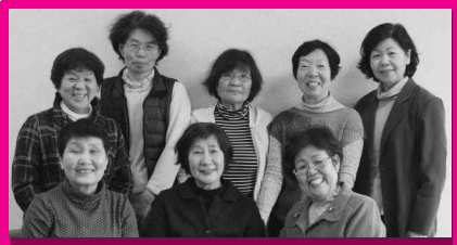
手引きボランティアグループ

手引きボランティアグループは20名のメンバーで、視覚障がい者の外出支援のほか、教育委員会主催の青い鳥学級参加者でのお手伝いや、小・中学生や高校生、一般の方々を対象とした「アイマスク体験」の指導を行っています。目の見えない人の気持ちを理解すると共に、接し方を学ぶ中で、障がい者との共生を理解し、豊かな社会へ繋がることを目指して活動しています。体験希望者や青い鳥学級生の参加をお待ちしています。