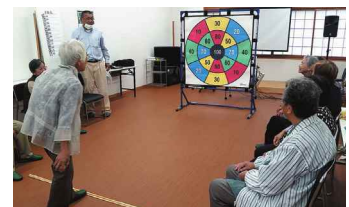
西横田町いきいきサロンの様子

詳細なつかみちは、 【はねっと】で検索を!! http://hanett.akaihane.or.jp