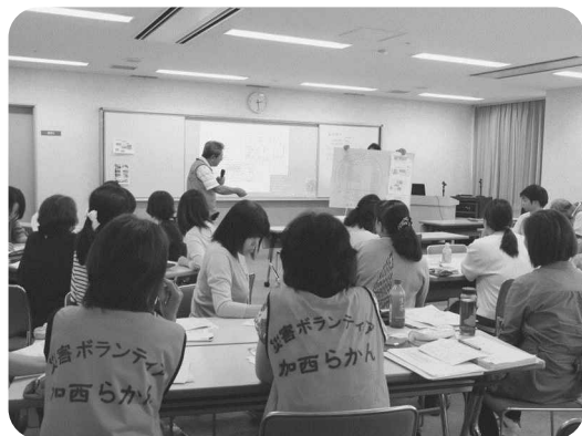
▲避難所運営の図上訓練の様子

はじめに、九州北部豪雨災害の状況や支援活動について先遣隊からの報告があり、グループ協議では、災害ボランティアセンター内における具体的な設置場所の検討や、避難所運営の図上訓練を行いました。