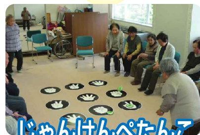
じゃんけんペタンこ