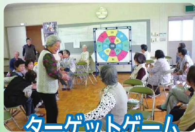
ターゲットゲーム