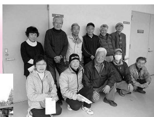
まごころ弁当宅配ボランティアグループのみなさん

金曜配達の「まごころ弁当宅配ボランティアグループ」は会員28人。市内で配食利用者にお