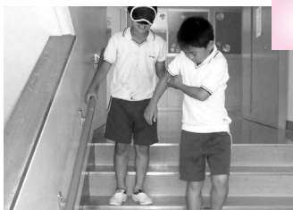
足元に気をつけてね