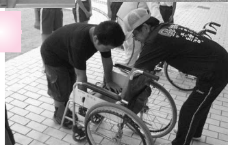
車イスはこう広げるとだよ