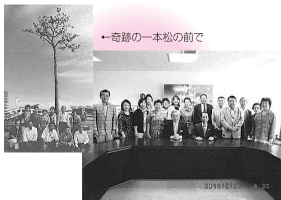
←奇跡の一本松の前で

復興ボランティアドリームクラブの役員様の案内で施設、被災現場、復興現場等20ヶ所の訪問と車窓からの説明で被災状況及び復興の様子を学ぶことができました。「えっ。まだこれだけ？」と進んでいない現地ではありますが、市長表敬訪問時の市長様の魂の響きで復興を確信できました。