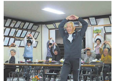
中野町いきいきサロンの様子