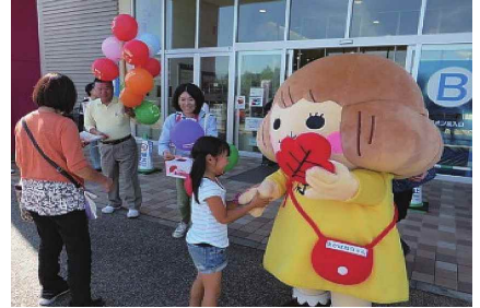
昨年の様子(イオンモール)