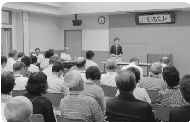
富合地区研修会の様子

ともに、今回の研修会で学ばれたことを参考に、各々の町に合った取組みが展開されることを願っています。