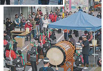
写真は、昨年の様子。