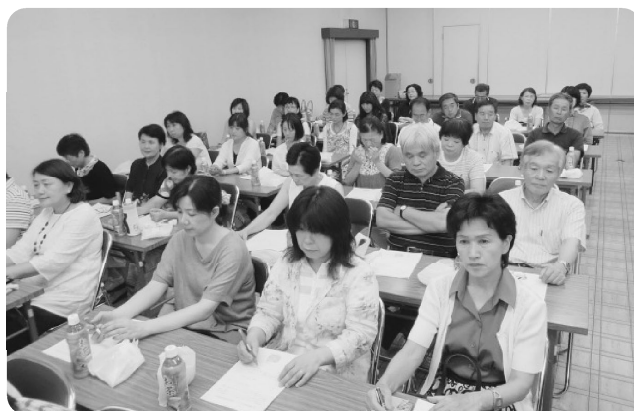
多加野地区研修会の様子