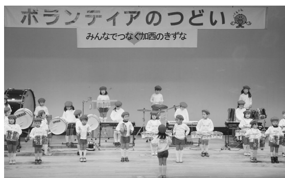
富田保育所マーチング演奏

オープニングではかわいい富田保育所園児の皆さんによるマーチング演奏で会場の雰囲気や和らぎました。また、兵庫県遊技業協同組合から福祉車両「はあーとふる福祉号」の寄贈式（3頁に関連記事あり）、長年のボランティア活動に貢献いただき模範となる方々に対して感謝の意を表し、加西市社会福祉協議会理事長から表彰・感謝状の贈呈を行いました。