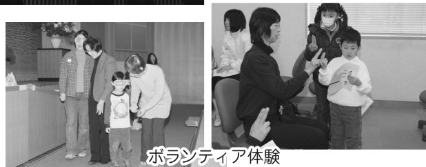
ボランティア体験