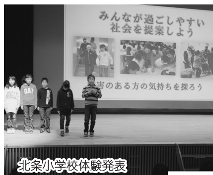
北条小学校体験発表