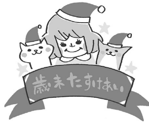
上若井町三世代ふれあい 餅つき大会