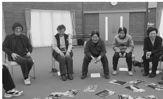
カルタの言葉に顔がほころんでいます

※サロンの掲載を希望される町があれば取材に伺います。 ご希望の町は右記までお申し出ください。地域福祉課 ☎43-1281